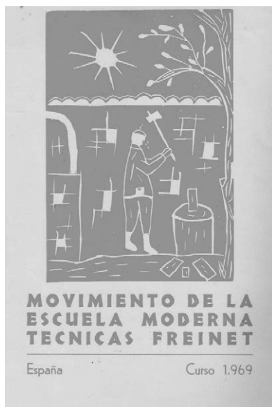
Fig. 5. Movimiento de la Escuela Moderna. Técnicas Freinet, 1969.