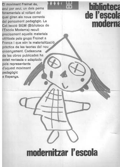
Fig. 6. Coberta de Modernitzar l'escola (Biblioteca de l'Escola Moderna, núm. 1, 1971).